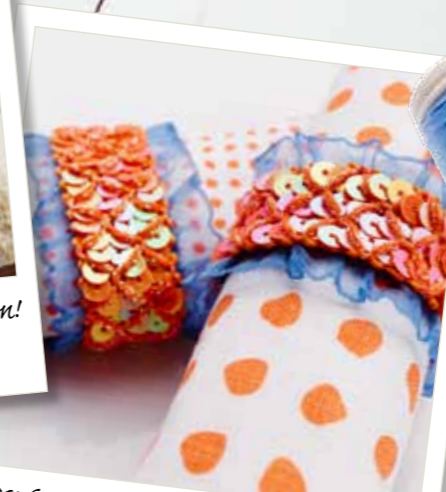
Diese Serviettenringe waren im Nu genäht! Zierbänder zusammennähen – im Handumdrehen!