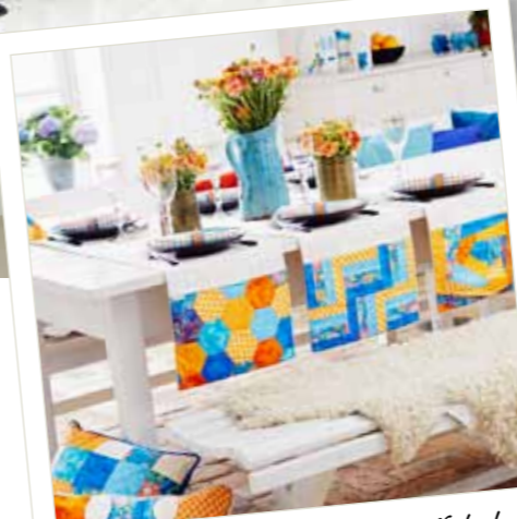
Einfach toll, was wir alles geschafft haben! Jetzt heißt es: Genießen!

Herzlich willkommen in der HUSQVARNA VIKING® Familie!